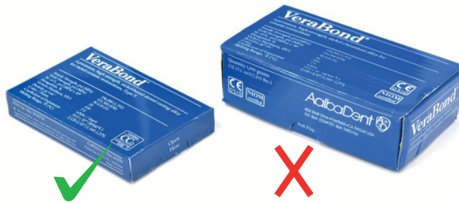
VeraBond sólo vende presentación de 200 g