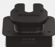
Kit de Arco

Máximo rendimiento Área de impresión 4 veces más grande