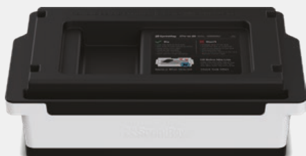
Tanque de Resina